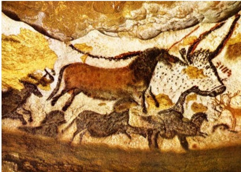
Lascaux, salle des taureaux

Avant l'invention de l'écriture, 38000 ans avant J-C , les hommes peignaient des images sur les murs de leurs cavernes. Certaines sont encore présentes, comme dans les grottes de Lascaux en France.