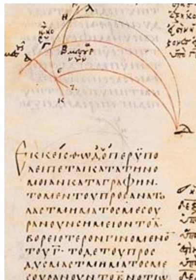
Version grecque de l'Almageste de Ptolémée Parchemin, IXe siècle.

□ 500 ans avant J-C , les Grecs adaptent l'alphabet phénicien et y ajoutent quelques lettres : A, E, I et O, qui sont les premières voyelles.