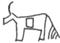
pictogramme d'une chèvre

3500 ans avant J-C en Mésopotamie, les hommes font des dessins sur des morceaux de pierre, qui représentaient des idées ou des objets. On les appelle des pictogrammes