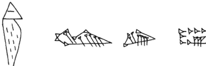
évolution du signe cunéiforme représentant un homme